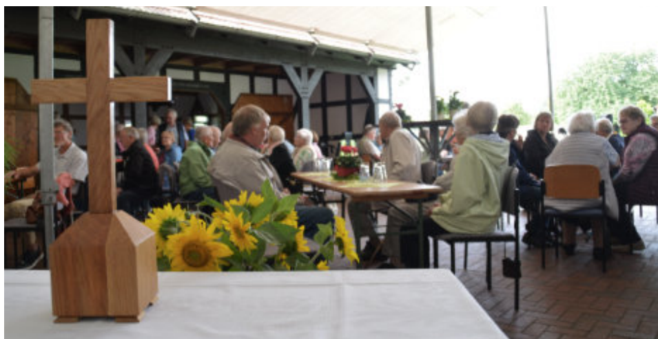
[Text & Fotos: D. Pieper]