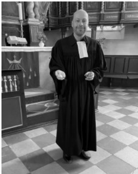
In Schwarzweiß nicht gut zu erkennen: Ein Schuh ist schwarz, der Andere rot