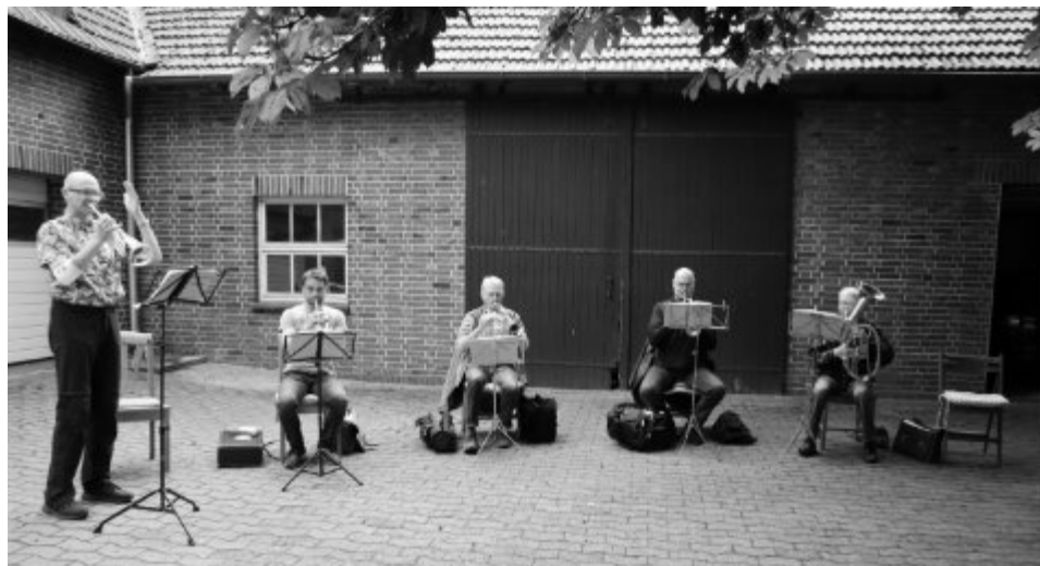
Der Posaunenchor Levern bei einer gemeinsamen Probe mit Abstand und unter freiem Himmel

Die gelockerten Auflagen ab Mitte Mai boten endlich nach 2-monatiger Sperre einen rechtlichen Rahmen zum Treffen und Musizieren in kleinen Gruppen. Die Abstandsregelungen waren zunächst so groß ausgelegt, dass wenig Probenräume der Größe nach infrage kamen. Zudem waren nur wenige öffentliche/kirchliche Räume überhaupt zur Nutzung für Gruppen und Vereine freigegeben.